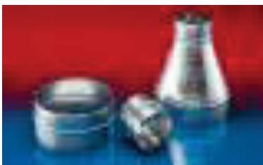
Schlauchverbinder /-reduzierung aus Blech.