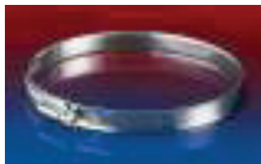
SHS – Schlauchschelle zur Befestigung von leichten und aussen glatten Schläuchen.