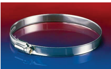
SHS – Schlauchschelle zur Befestigung von leichten aussen glatten Schläuchen.