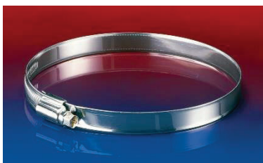
SHS – Schlauchschelle zur Befestigung von leichten aussen glatten Schläuchen.