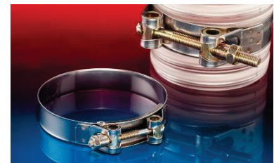
SHSB – Gelenkbolzenschelle zur Befestigung von schweren und aussen glatten Schläuchen