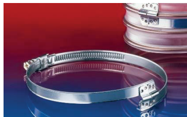
BS – Brückenschelle zur Befestigung von aussen gewellten Schläuchen.